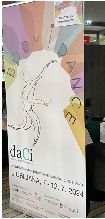
2024 daCi 海報主視覺