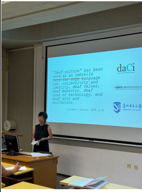
論文發表過程紀錄