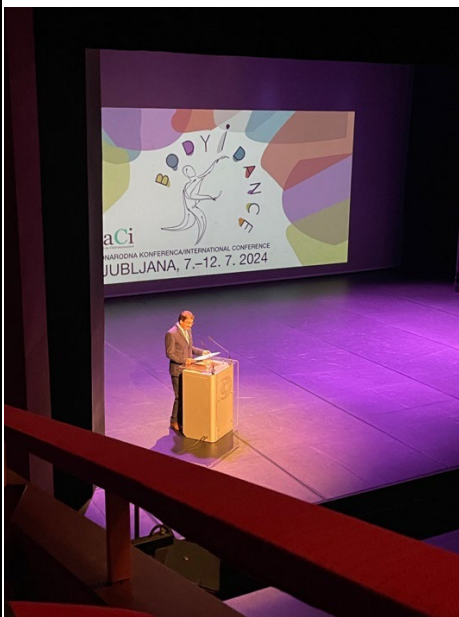
2024 daCi 開幕活動