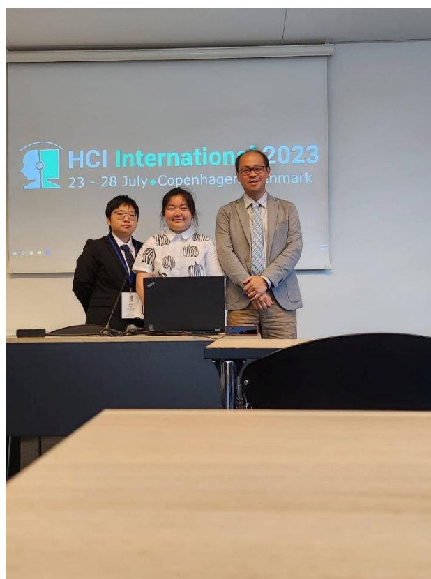
圖 4 口頭報告後合影