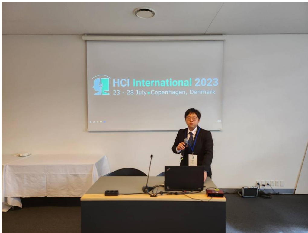
圖 3 口頭報告現場