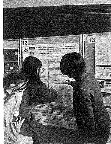
論文發表與會者詢問問題