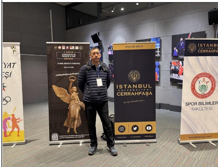
發表地點伊斯坦堡大學