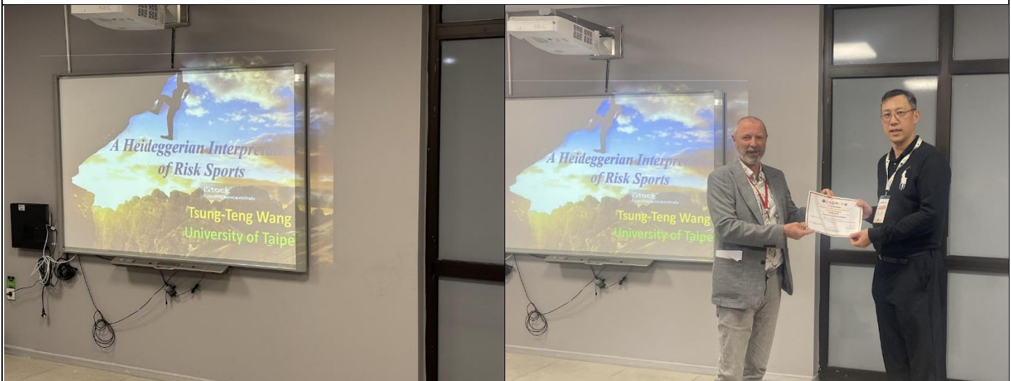
此次研討會發表的主題