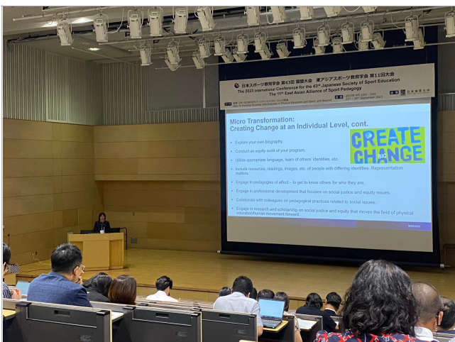
• 照片說明：參與大會演講