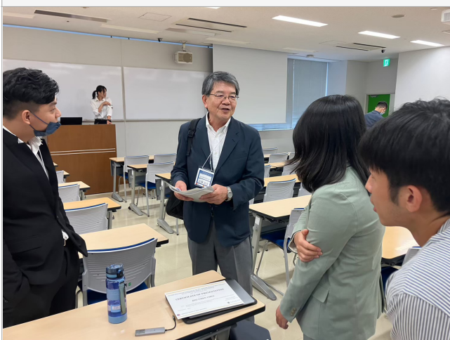
• 照片說明：與日本學者學術討論