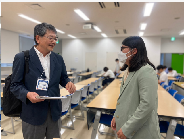
• 照片說明：與日本學者學術討論