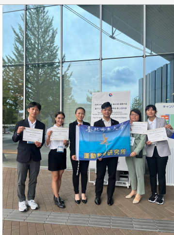
• 照片說明：運教所學生取得證書大合照